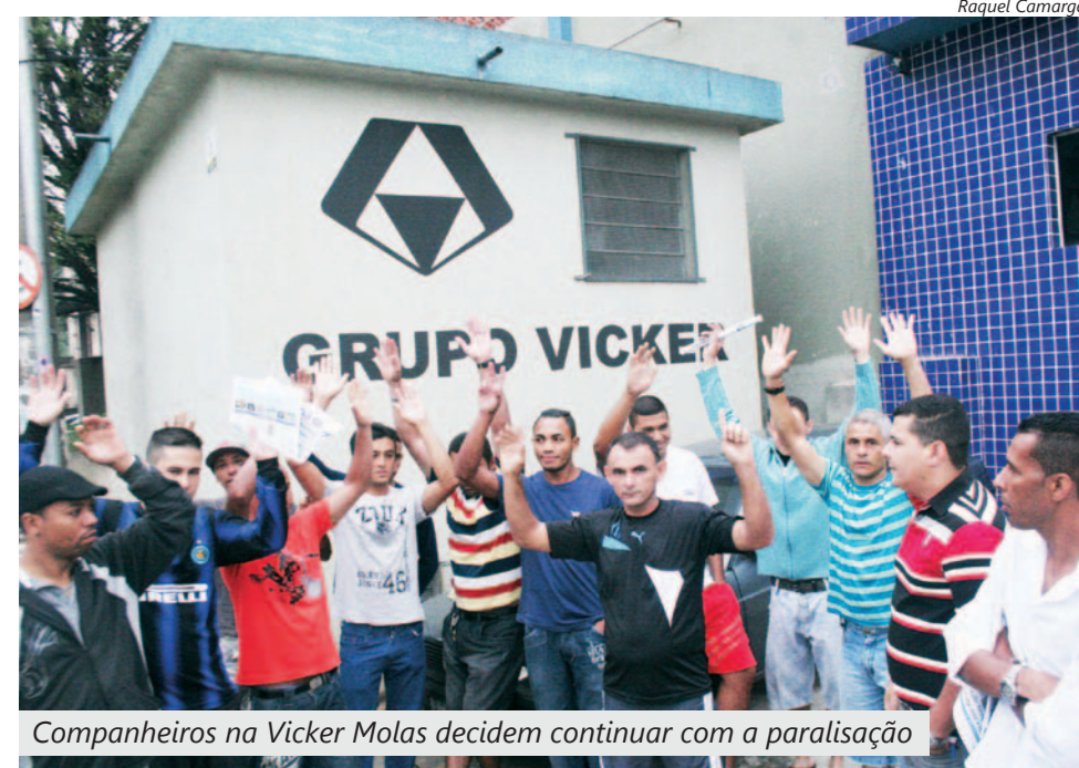
Companheiros na Vicker Molas decidem continuar com a paralisação